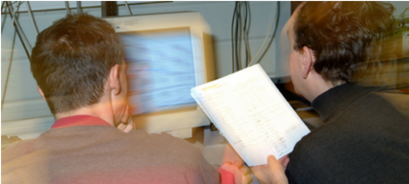
Wirtschaftsingenieurwesen: Ein Spannungsfeld zwischen Wirtschaft, Technik und Recht

Wer Wirtschaftsingenieur werden will, hat zwei Möglichkeiten: Er kann ein grundständiges Simultan- oder ein Aufbaustudium absolvieren.