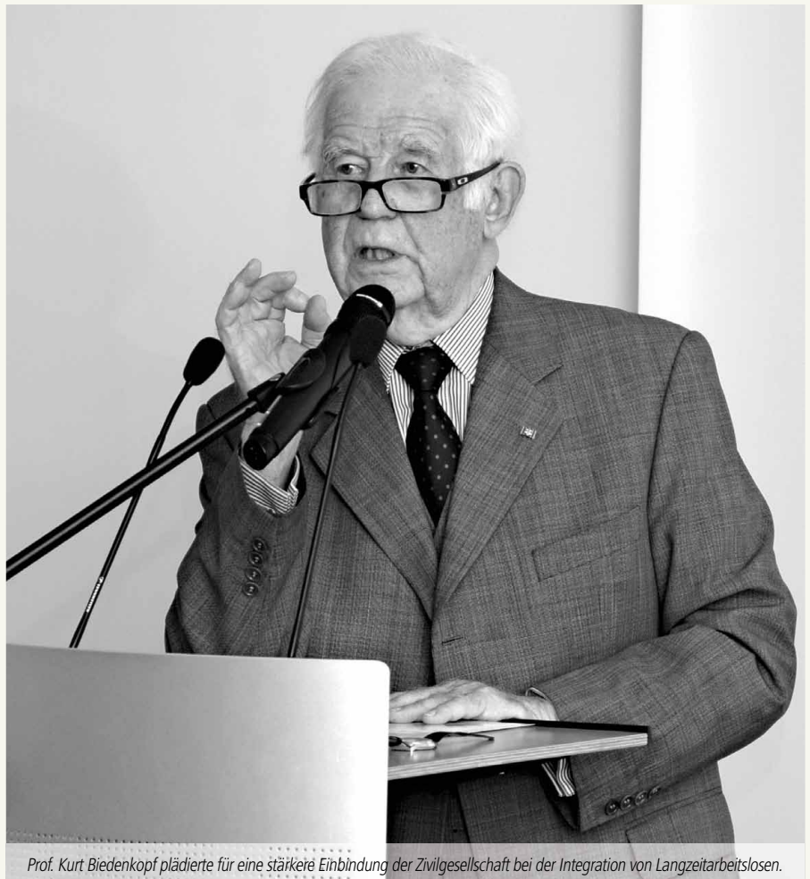
Prof. Kurt Biedenkopf plädierte für eine stärkere Einbindung der Zivilgesellschaft bei der Integration von Langzeitarbeitslosen.