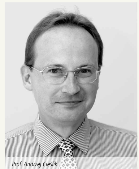
Prof. Andrzej Cieřlik

polnische Firmen untersucht werden können. Hierzu wird eine Kooperation des Forschungsbereichs mit Prof. Cieřlik angestrebt.