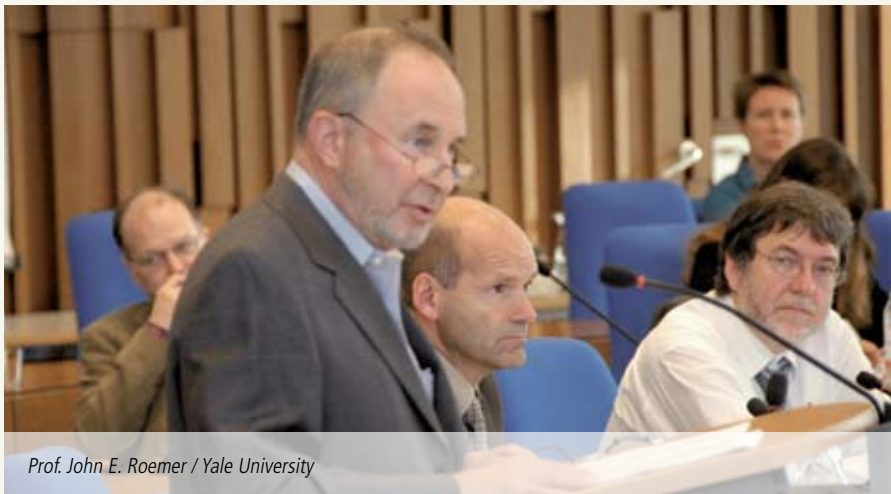
Prof. John E. Roemer / Yale University

in Nürnberg stattfand, wurde gemeinsam mit dem Ausschuss für Sozialpolitik des Vereins für Socialpolitik und der Sektion für Soziale Ungleichheit und Politische Soziologie der Deutschen Gesellschaft für Soziologie organisiert. Die zumeist stark empirisch ausgerichteten Beiträge des Workshops befassten sich nicht nur mit dem Thema Lohnungleichheit, etwa zwischen den Geschlechtern, sondern auch mit den Verteilungswirkungen des Steuer- und Transfersystems. Höhepunkte des Workshops waren aber zweifelsohne die Vorträge der eingeladenen Hauptredner, die die wissenschaftliche Diskussion mit grundlegenden theoretischen Überlegungen befruchteten und strukturierten.