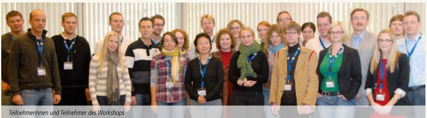
Teilnehmerinnen und Teilnehmer des Workshops

Weitere Informationen im Internet unter: