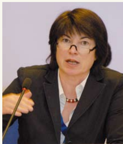
Christiane Voß-Gundlach / Bundesministerium für Arbeit und Soziales