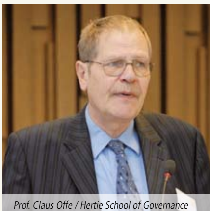
Prof. Claus Offe / Hertie School of Governance

Fragen, die sich gerade in der gegenwärtigen Wirtschaftskrise in verschärfter Form stellen – fürchten doch viele, dass insbesondere die Normal- und Geringverdiener die Lasten der Krise zu tragen haben. Grund genug für das IAB, Forscherinnen und Forscher aus dem In- und Ausland zusammenzubringen, um das Thema aus unterschiedlichen Perspektiven zu diskutieren. Diesem Ziel diente der interdisziplinäre Workshop „Labour, Markets and Inequality“, der mit über 70 Teilnehmerinnen und Teilnehmern auf reges Interesse stieß. Die Veranstaltung, die am 24. und 25. September 2009