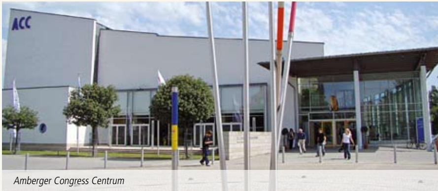
Amberger Congress Centrum