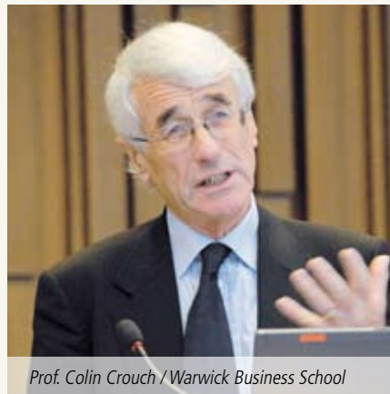
Prof. Colin Crouch / Warwick Business School

wettbewerbsfähig zu bleiben? Gibt es einen Trade-off zwischen Gleichheit und Effizienz?