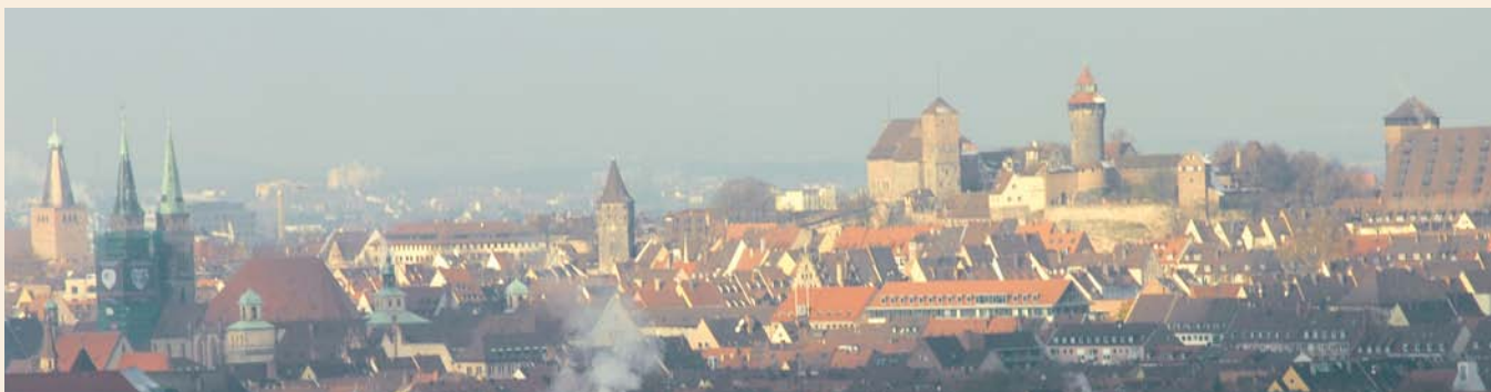
Nürnberger Altstadt mit Burg

im Arbeitsleben zu bleiben, genau so wichtig wie die aktive Nutzung des von den Betrieben hochgeschätzten Erfahrungswissens älterer Arbeitnehmer. Zur Umsteuerung in der Altenpolitik könne darüber hinaus auch die Arbeitsmarktpolitik mit Maßnahmen des Förderns und Forderns Älterer beitragen. Insgesamt hat die Veranstaltung gezeigt, wie wichtig die öffentliche Diskussion dieses Themas ist. Deutschland muss einen Paradigmenwechsel vollziehen und sich von der noch immer weit verbreiteten Frühverrentungsmentalität lösen. Auch eine bessere Vermarktung positiver Beispiele von Betrieben, die ein erfolgreiches Altersmanagement betreiben, könnte zum Umdenken beitragen.