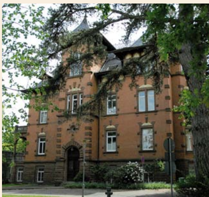
Villa Vopelius, Evangelische Akademie Bad Boll

Die Situation auf dem Arbeitsmarkt bleibt eine zentrale Herausforderung für Politik und Gesellschaft. Zu den Reformen der Jahre 2003 bis 2005 liegen Evaluationen und praktische Erfahrungen in der Umsetzung und Anwendung der eingeführten Instrumente vor. Sie wurden auf der gemeinsamen Fachtagung des IAB und der Evangelischen Akademie Bad Boll am 7. und 8. Mai 2007 präsentiert und bewertet.