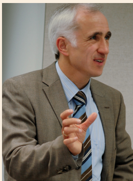
W. Arndt Bertelsmann / W. Bertelsmann Verlag (wbv) Bielefeld

Zu diesem Zweck hatte der IAB-Servicebereich „Publikation, Presse- und Öffentlichkeitsarbeit“ am 28. und 29. Juni 2007 nach Lauf zu einem Workshop eingeladen – Forscherinnen und Forscher aus dem