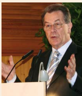
Franz Müntefering / ehem. Bundesminister für Arbeit und Soziales (BMAS) Berlin