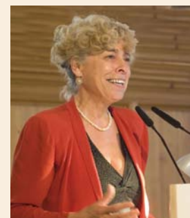
Gesine Schwan / Europa-Universität Viadrina, Frankfurt/Oder