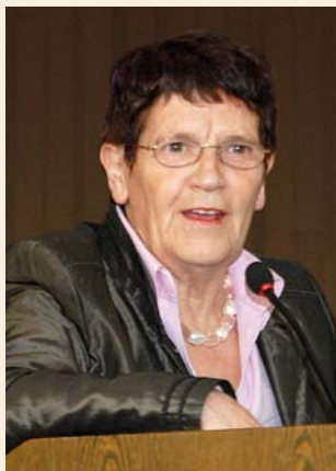
Prof. Dr. Rita Süßmuth, Bundestagspräsidentin a.D.

Trotz vielfältiger Integrationsangebote deutet viel darauf hin, dass sich die Integrationschancen von Spätaussiedlern in den Arbeitsmarkt und ins Bildungssystem verschlechtern. Der Workshop, der am 29. und 30. März 2007 Experten aus Wissenschaft und Praxis in Nürnberg zusammenführte, ging der Frage nach, mit welchen Problemen Spätaussiedler in Deutschland heute konfrontiert sind und was ihre Probleme von denen der ausländischen Mitbürger unterscheidet. Einigkeit bestand darin, dass sich die ungünstige