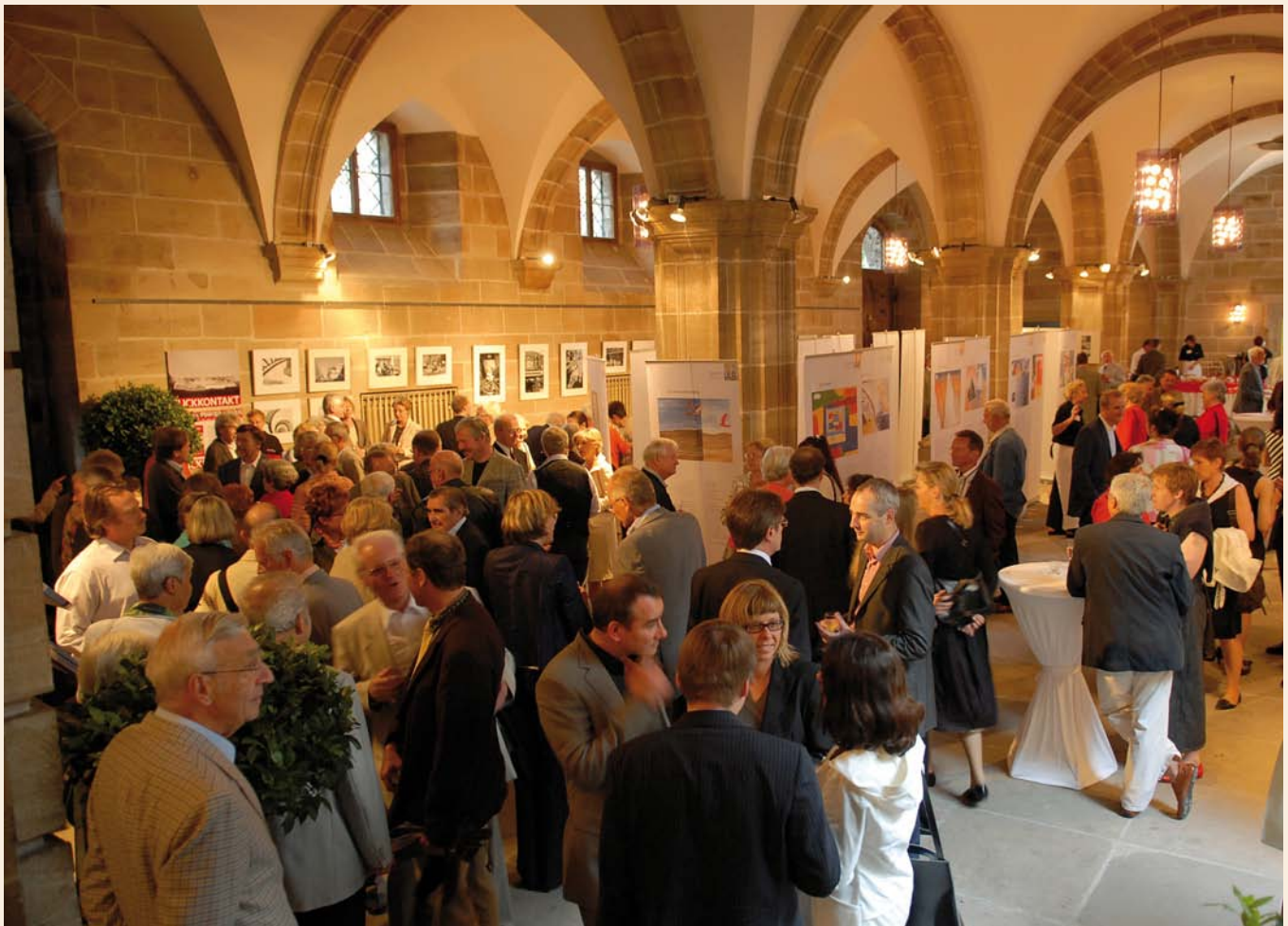
Plausch in der Ehrenhalle