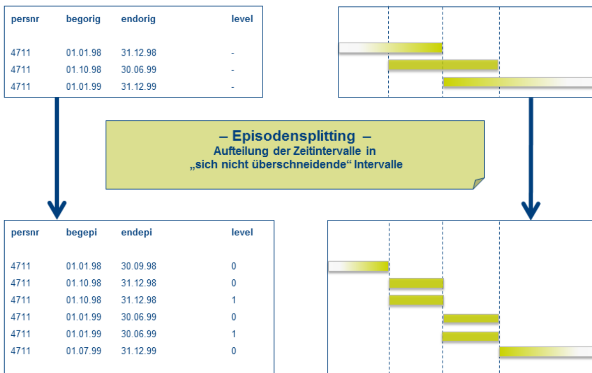
Abbildung 2: Episodensplitting